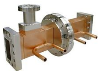
Sバンド真空引口付真空窓