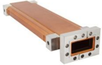
Sバンドハイパワーダミーロード