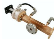
Xバンドサファイア窓