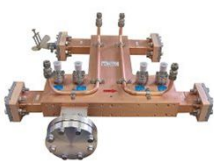
Cバンドハイブリッド