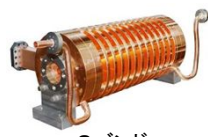
Sバンド チョークモード型 加速管