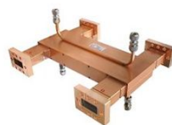
Cバンドハイブリッド