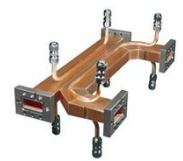
Sバンドハイブリッド