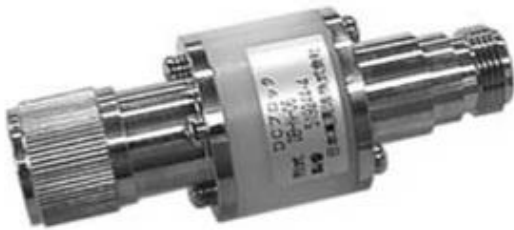
DB-N-01 DB-N-01X1 DB-N-06

同軸線路の内外導体が容量結合により、絶縁されています。 ノイズカット絶縁が必要な場合に使用してください。